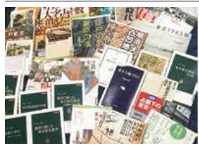
「ふるさと東京」をテーマにした本

4年後に開催されるオリンピックを前に東京は大きく変貌しています。渋谷駅周辺などは全く変わってしまいました。1964年の東京オリンピックの時も東京は大きく変わりましたが、その当時とは比較にならない変化です。三宅村図書館では、東京の原点となる江戸も含めた、歴史や地