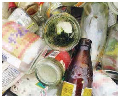
分別しないで出された「不燃ごみ」

ビン・缶・ペットボトルは洗って、ふたやラベルをはがして他のごみの混入がないように出してください。問い合わせは地域整備課環境整備係 ☎0938009