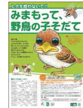
「みまもって、野鳥の子育て」のチラシ

親鳥がすぐそばで待っていますか? 羽毛があれば、あどけなくとも「独り立ち準備中」の巣立ちヒナです。鳥の子の「誘拐」にならないように、落ちて着いて行動しましょう。