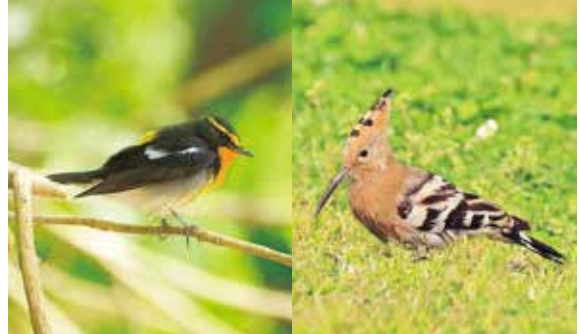
キビタキとヤツガシラ。こんな野鳥との出会いも春ならではの

三宅島自然だより 「春の渡り鳥が 続々と」 街のなかではツバメが飛び、野鳥のさえずりも良く聞こえるようになりました。いよいよ春本番、バードアイランド三宅島本番です。三宅島では年間120〜140種ほどの野鳥が記録されますが、その多くは4月〜6月に確認されています。