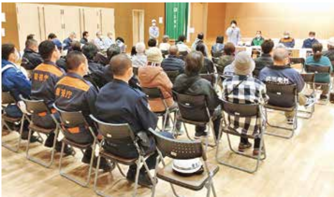
避難訓練の講評を聞く参加者の皆さん

1月26日(日)、坪田地区の津波浸水想定区域周辺の居住者を対象に防災関係機関の協力のもと津波避難訓練を実施しました。