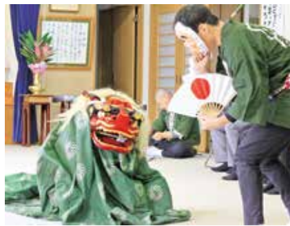
初午祭で舞う獅子舞