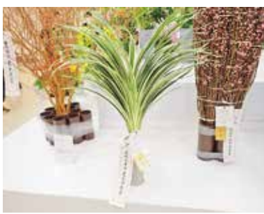
金賞(農林水産省 農産局長賞)を受賞したキキョウラン

1月29日(水)から2月2日(日)まで、池袋サンシャインシティにおいて「第73回関東・東海花の展覧会」が開催されました。この展覧会は、関東から東海地方までの1都11県の花の生産者が切花や鉢物などを出品し、品質と商品性を競う国内最大規模の伝統ある花の展覧会です。