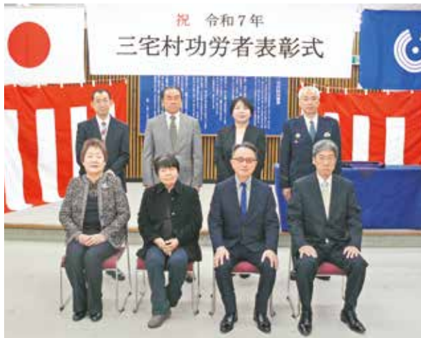
記念写真に納まる受賞者ら

令和7年三宅村功労者表彰式が「村民の日」の2月1日(土)午前10時から三宅村役場臨時庁舎において行われ、「各界の功労者」に表彰状と記念品が贈られました。