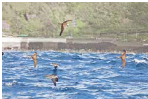
この鳥が群れている海でカツオが多く採れたのが地方名の由来

海上を大群で舞う鳥が帰ってきました。島ではカツドリとかカツドリとか呼ばれていますが「オオミスナギドリ」が正式な名前です。昨年11月頃、夜に道端でうずくまっていた鳥を見た人も多いと思いますが、それらの鳥です。伊豆諸島では御蔵島や利島で子育てを行い、真冬の間だけ、東南アジアやオーストラリア北部で過ごし、3月頃再びやってきます。