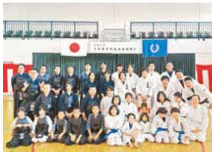
鏡開きの集合写真

1月13日(月)、三宅村コミュニティセンターにおいて、三宅島柔道連盟、剣道連盟合同の「令和7年三宅島柔剣道連盟鏡開き」が開催されました。 柔道の部では、昇級認定証授与や基本錬成、紅白試合が行われました。剣道の部では昇段証書の授与や基本錬成、紅白試合が行われ、日本剣道形や真剣による演武が披露されました。