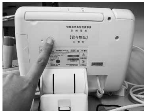
本体の裏側にある電源ボタン