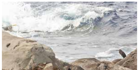
ダイサギ(左)とクロサギ(右)

「三宅島自然だより 磯にいる 黒い鳥は?」 冬、海岸の岩場で大きな黒い鳥を見ませんか? 黒い鳥の正体は冬になると目立ってくるウ科の仲間です。また、ハシブトガラスは1年を通してよく見ますね。さらにもう1種、全身真っ黒なサギを見たことありませんか。クロサギというサギで1年を通して三宅島に生息していると考えられます。しかし個体数が少なく、さらに体の色が黒い溶岩に溶け込み、なかなか見つかりません。保護色となっているのですね。沖繩などの南の方で生活するクロサギは体の色が真っ白だそう。真っ白なクロサギ。なんだか不思議ですね。