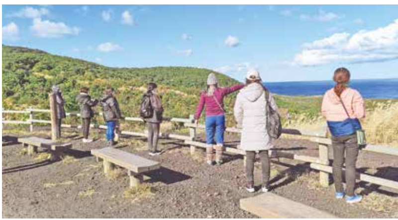
三七山で自然ガイドの説明を聞く参加者ら

当初は1月10日(金)からツアーの予定が組まれておりましたが、海上不良により1日少ない期間での開催となりました。