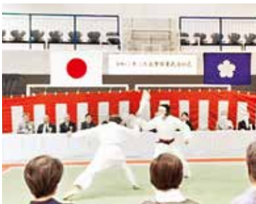
ソフト警棒での紅白試合の様子

毎年恒例の武道始式は地域の治安や自身の身を守るため、署員が日頃鍛錬している成果を披露する場です。 警察署員と子どもたちによる剣道高次試合・柔道高次試合、署員対抗ソフト警棒紅白試合、川越師範およ