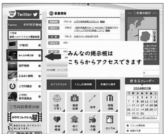
みんなの掲示板はこちら