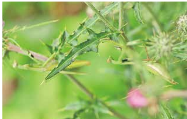
緑色のコカマキリ

三宅島にはカマキリが何種類かいます。が、コカマキリは腕の内側に白と黒の模様があり、ひと目で見分けることができます。体の色は茶色が殆どで緑色のコカマキリは大変珍しいこの事です。 しかし、三宅島では緑色のコカマキリをよく見ます。以前、阿古と坪田でコカマキリを探したと