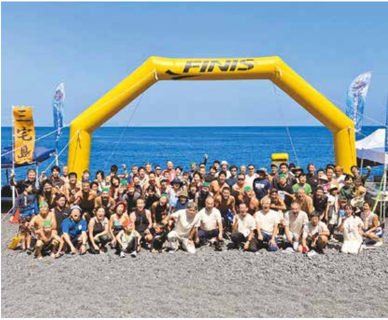
集合写真に写る参加者ら

「挑むは黒潮」を合言葉に、9月7日(日)「三宅島OWS大会2024」が大久保浜海水浴場で開催されました。