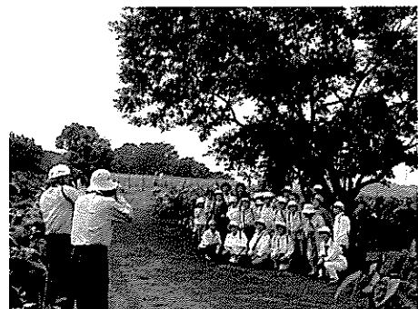
サトイモ畑をバックに記念撮影