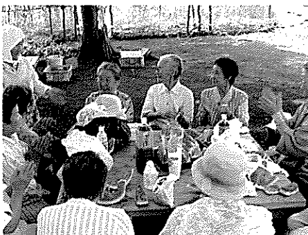
思いを島節にのせて。手拍子はいつまでも続いていました。