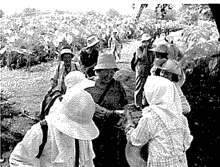
手を取り合って再会を喜ぶ皆さん

楽しいひとときを過ごした一行は、次回は秋の収穫時期の再会を約束して、別れを惜しみながら農場を後にしました。迎えた私たちにとっても、心温まるひとときとなりました。