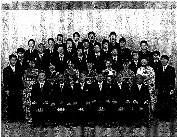
大人の仲間入りをした新成人の皆さん