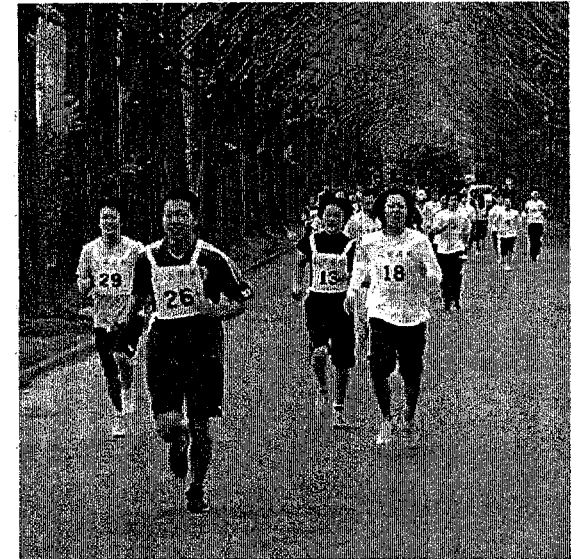
マラソン大会で力走する高校生たち

農業者の先生の指導で三宅のイモもちを作り、三宅島のもちつき文化も継承できそうです。