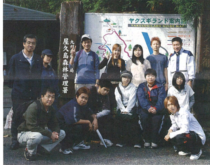
森や水の豊かさがいっぱい(ヤクスギランドで)

争したり、飛びこんだり いうガイドさんに筋がい とそれはにぎやかで、水 の豊かさを心ゆくまで楽 しまひとき。三宅島 にも住んだことがあると 島は足りなかつたけれ ど、屋久島を巡る中で、 あらためて三宅島や御蔵 島との共通点や違いを思 い起こさせる3日間にな りました。 最終日、鹿児島に戻り 桜島一周観光と特攻隊基 地となった知覧町を見学 して、今回の修学旅行を 締めくくりました。 今年は異常に台風も多 く気をもみましたが、台 風21号と22号のはざまを ぬって、天候にめぐまれ、 すばらしい修学旅行にな りました。 2年生は、修学旅行の 経験と楽しさを心に刻 み、これからもフットワ ークの良さを生かし、希 望する進路の実現に向け て高校生活を楽しみま す。