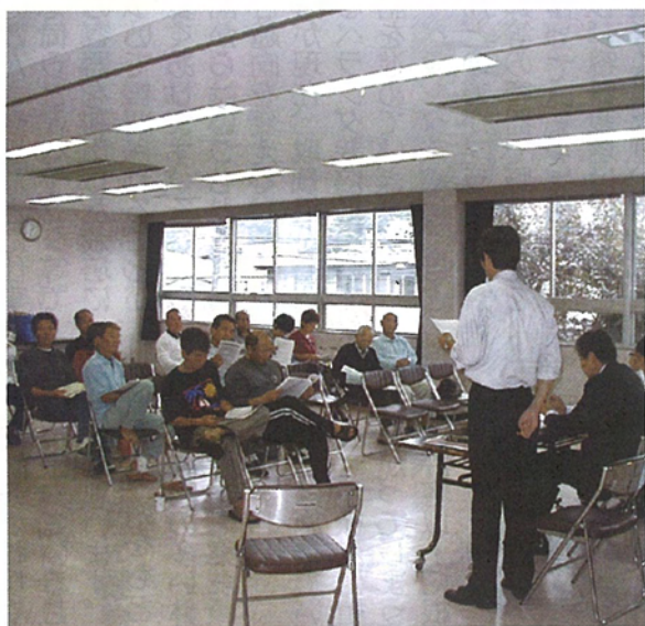
下田市中央公民館の説明会

なお、10月9日に予定していた三宅島でのミニ説明会は台風のため中止となりました。