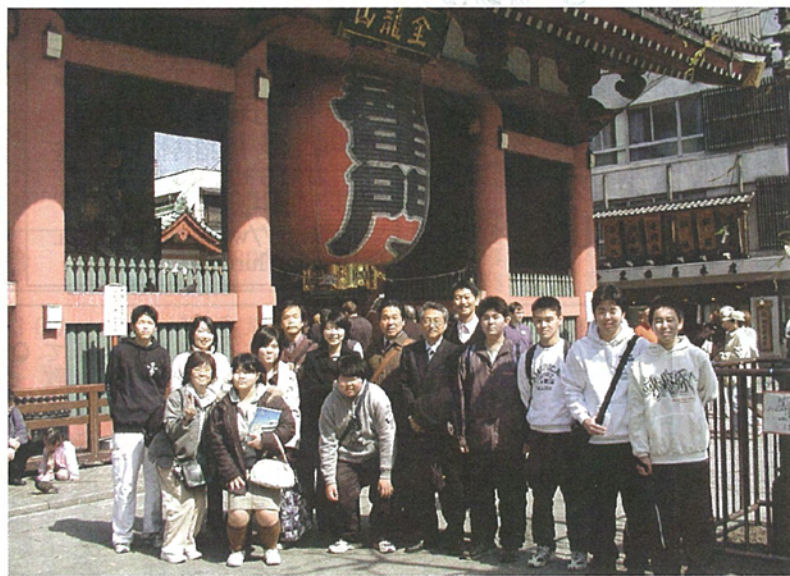
浅草の雷門前で記念撮影

浅草寺を参拝し、昼食は仲見世近くのしにせて舌鼓を打ちました。その後、この日のメインイベント、江戸東京博物館の見どころでは川面を渡る清々しい風から、いつしかあの懐かしい潮の香りへと変わり、ふるさとの海を思い出した生徒もいました。 3年生はもうすぐ卒業します。三宅村立中学校といっても、避難のため秋川で学んだ3年間でした。しかし、この3年間、どの生徒も確かに輝いていました。巣立ち行く若人の未来に、幸多かれと祈ります。 (三宅村立中学校)