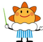
気象庁 マスコットキャラクター 「はれるん」

本特設サイトでは、気象庁のマスコットキャラクター「はれるん」と、桜島がある鹿児島地方気象台のマスコットキャラクター「ぼるけん」のやりとりを通して、火山や火山防災について学ぶコンテンツを多数用意しています。