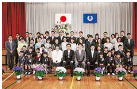
小学校の新1年生と保護者ら

4月9日、三宅村立三宅小学校、三宅村立三宅中学校、東京都立三宅高等学校にてそれぞれ入学式が挙行されました。