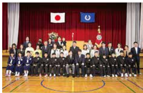
中学校の新1年生と保護者ら