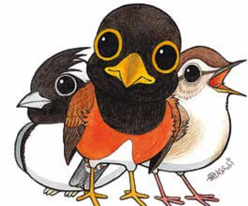
三宅島を代表する野鳥たち。特別描きおろし版です。