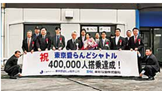
東京愛らんどシャトル40万人搭乗記念式典