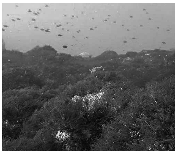
写真1 深いところに生えていたマクサ(平成29年1月撮影)

三宅島を代表する海産物である「テングサ」は、岩に着生するテングサ科に属する海藻の総称で、主な漁業対象となっているものはオオブサ(三宅名:あら いたためです。大島事業所では、毎年春にテングサ類の調査をしています。昨年は多少着生量が増加したものの、まだまだ低い水準です(図1)。