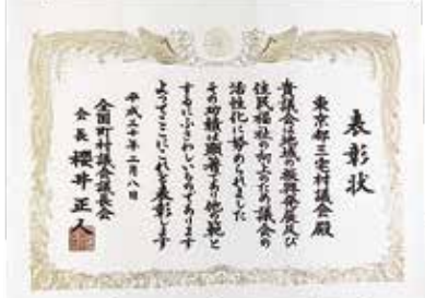
全国町村議会議長会の賞状

2月8日の全国町村議会議長会第69回定期総会において、三宅村議会が町村議会表彰を受賞しました。 町村議会表彰は議会活動が「政策づくりと監視機能を十分発揮している議会」「住民に開かれた議会」「地域振興のために特別な取り組みをした議会」として他の範とするに足る活動を行っている」と認められる議会が表彰されるものです。 三宅村議会は、平成28年に東京都島嶼部で初となる東京都島しょ町村議員セミナーの開催や先進地視察において政策や取り組みなどを学び、村の問題解決に向けて積極的に活動した功績が認められました。