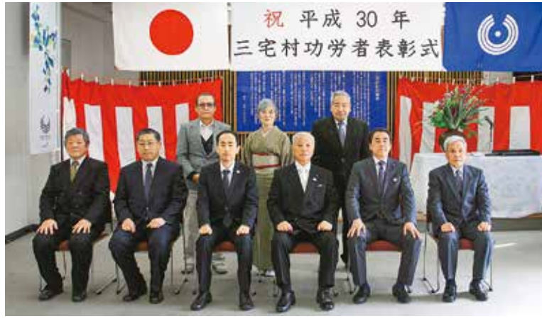
写真に納まる平成30年三宅村功労者ら

平成30年三宅村功労者表彰式が「村民の日」の2月1日午前10時から三宅村役場臨時庁舎において行われ、「各界の功労者」に表彰状と記念品が贈られました。