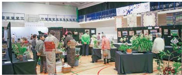
人でにぎわう会場