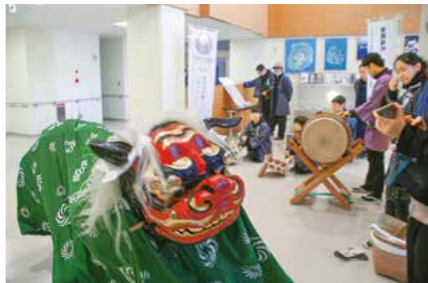
人々の前で舞う獅子

獅子が各家庭を踊り歩き、厄払いをする「初午祭」が行われました。初午は各地区の青年団や芸能保存会によって独自の形式で伝統が受け継がれていて、今年も2月10日に阿古、伊豆地区で、11日に神着、伊ヶ谷、坪田地区で行われました。獅子に頭を噛んでもらうと厄払いができる、無病息災など言われており、今年も2月の伝統の祭はにぎやかに開催されました。