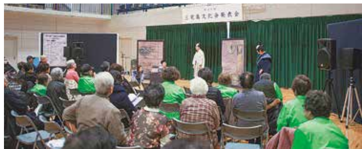
舞台発表で行われた演劇

第24回三宅島文化会発表会が開催されました。発表会には多くの個人や団体の会員が参加し、会場には華道、書道、絵画、写真、工芸、手芸などの作品が並び、舞台では歌、楽器演奏、演劇などが披露されました。