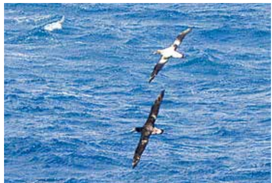
アホウドリ(翼を広げた長さは2m以上の大きな鳥)

アホウドリ。このインパクトのある名前を誰でも一度は聞いたことがあるのではないのでしょうか。名前に外は馴染みがうすく、現実にはいない鳥とされている方もいるかもしれませんが。実際、地球上から姿を消したと考えられていた時期もありました。しかし、三宅島近海では冬から春にとぎとぎ見られ、特に東海汽船の航路などではよく見られます。体が大きいため、沖を飛んでいてよく目立ち、昨年3月には島内からも50羽ほどが見られた