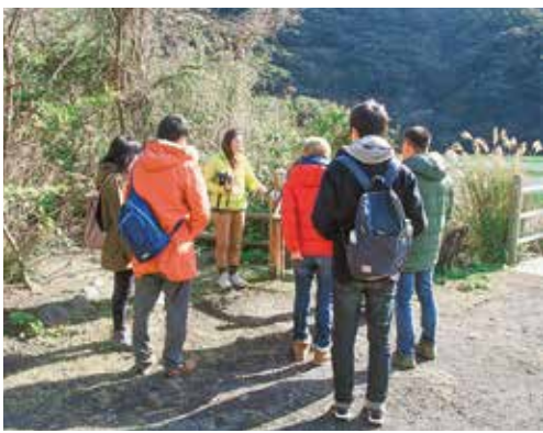
島内ツアーで自然ガイドの説明を聞く参加者ら

2月8日から2月15日(短期コース)は2月12日まで、第6回目となる「三宅村島ぐらし体験事業」が実施され、島外から8人の方が参加しました。 前回同様、島内で求人募集を行っている事業所の相談会を実施したほか、村役場、三宅島観