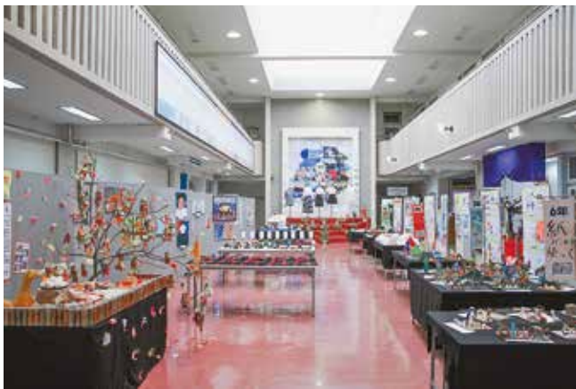
子どもたちの作品が展示された会場

1月18日から24日までの7日間、三宅村郷土資料館1階ホールで「保小中高合同作品展」が開催されました。