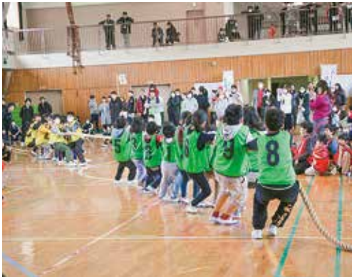
白熱する小学生の部

2月4日午後1時半より、都立三宅高等学校体育館にて「三宅村民の日」第6回綱引き大会が開催されました。出場チームは小学生の部が5チーム、中学生の部が4チーム、一般男性の部が9チーム、一般男女混合の部が11チームで、応援の方も含め