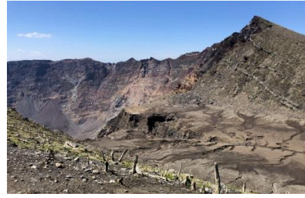
雄山火口付近の様子